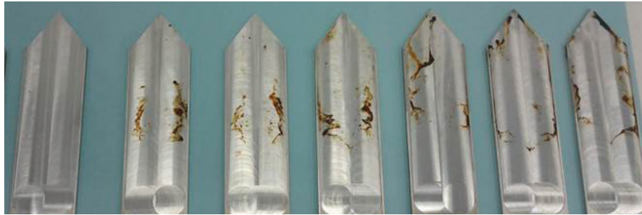
Компрессорное масло PURITY FG Конкурент F, синтетическое масло Конкурент E, синтетическое масло Конкурент D, синтетическое масло Конкурент A, синтетическое масло Конкурент C, синтетическое масло Конкурент B, синтетическое масло

Компрессорное масло PURITY FG продемонстрировало значительно более низкий уровень нагара по сравнению с синтетическими маслами конкурентов.